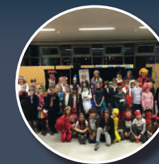
Voyage en Allemagne Février 2020