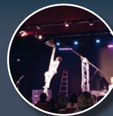
Spectacle de Noël 2019 élémentaire : « Le fabuleux retournement d'Eugène Ouisqi » de Rocco Le Flem (d'Igny)