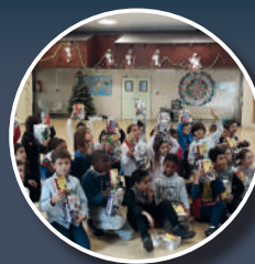
Distribution de dictionnaires