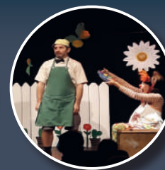
Spectacle de Noël 2019 maternelles : « chez toi chez moi » de la compagnie De ci de là.