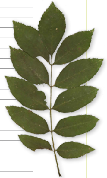
Le Frêne élevé, un arbre à planter sur les sols frais à humides.