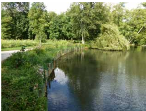
Exemple de travaux de restauration de berges par des techniques de génie végétal.

Les végétaux à implanter devront donc être choisis en fonction de ces conditions stationnelles.