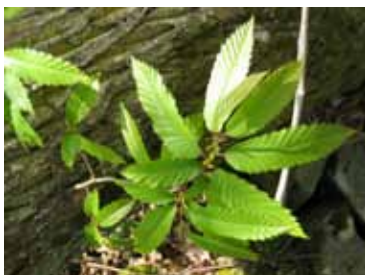
Le Châtaignier , un arbre à planter sur les sols pauvres et sableux.