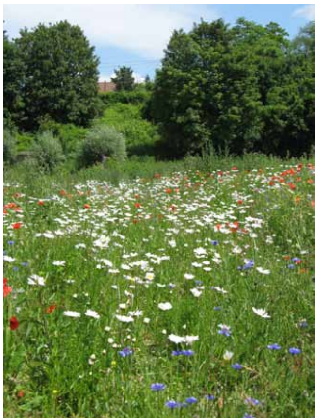
La restauration d'un couvert herbacé est intéressante surtout lorsque le milieu initial est très dégradé.