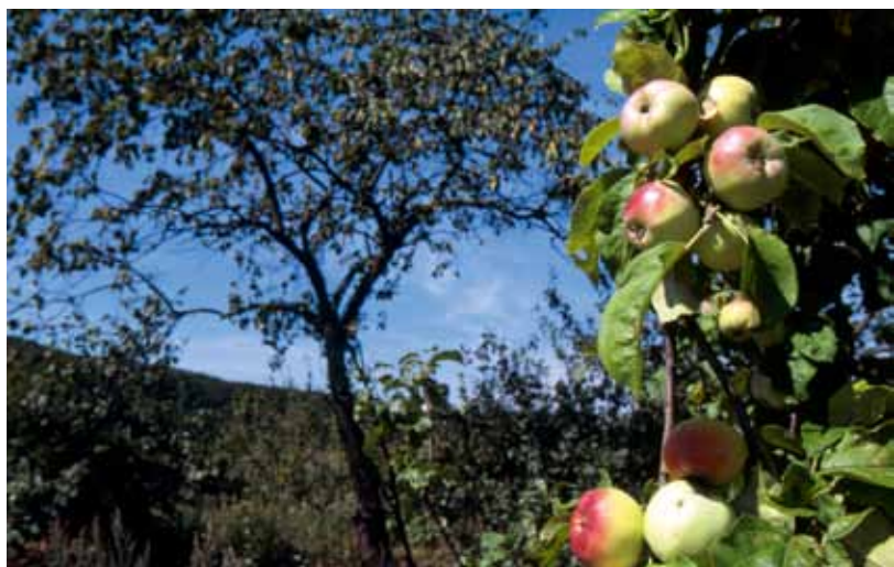
La replantation de variétés anciennes de fruitiers permet d'allier des objectifs écologiques, paysagers et culturels.

Il s'agit pourtant d'un patrimoine génétique, paysager, culturel et écologique de grande valeur. À l'occasion de travaux de réhabilitation sur un ENS, il peut donc être intéressant de replanter des variétés anciennes et locales de fruitiers. Celles-ci sont intéressantes à plusieurs titres: adaptation aux conditions naturelles locales, goût, résistance, maturité échelonnée, usages multiples (table, cuisson, boisson...). Les vergers peuvent aussi accueillir une diversité floristique et faunistique intéressante (chouette chevêche, insectes...) et contribuer à la trame verte.