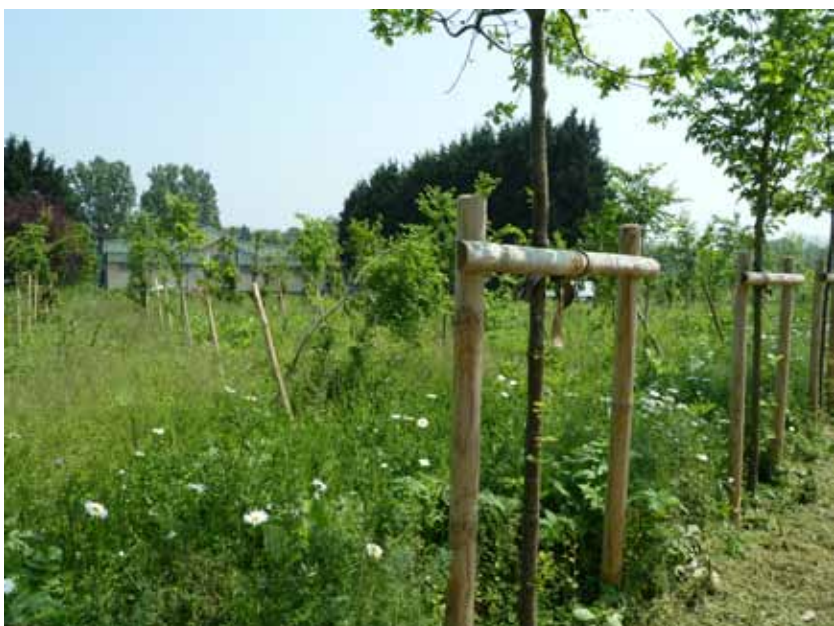
Sur les ENS, les plantations doivent être menées en accord avec les caractéristiques écologiques et paysagères du site.